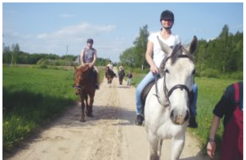
«Drostaļās» izjādes piedāvā gan jāšanas laukumā, gan apvidū.