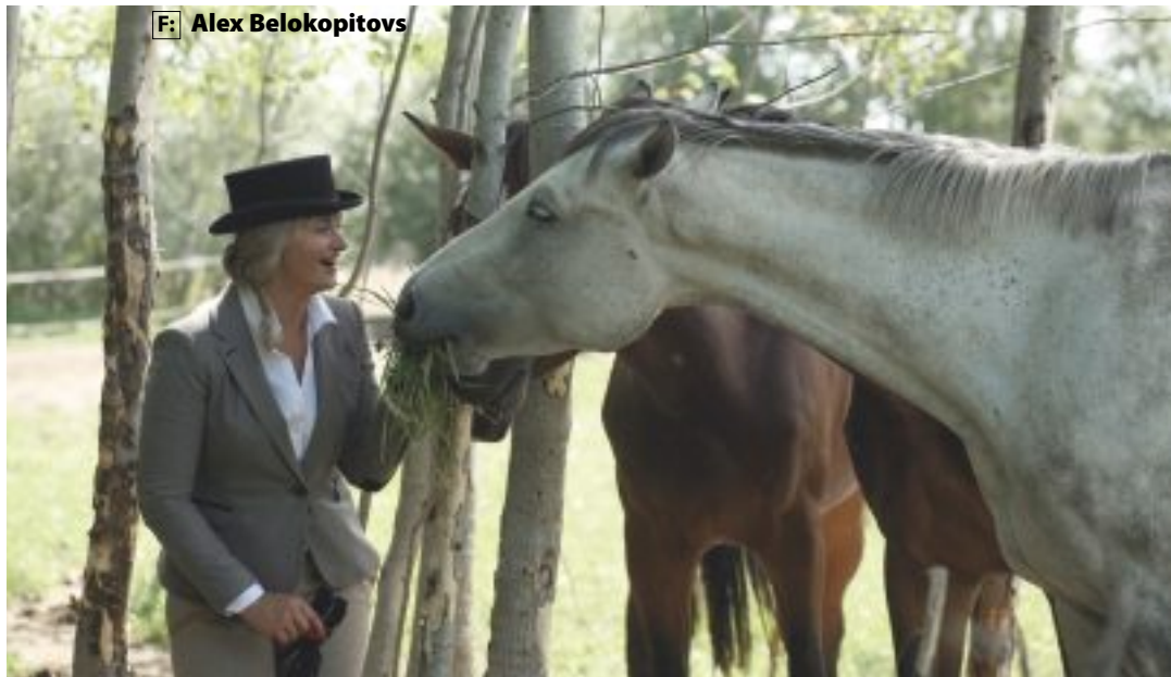
Lindai šķiet, ka jātnieks zirgā ir lielāks virtuozs, nekā pasaules slavenākais pianists.