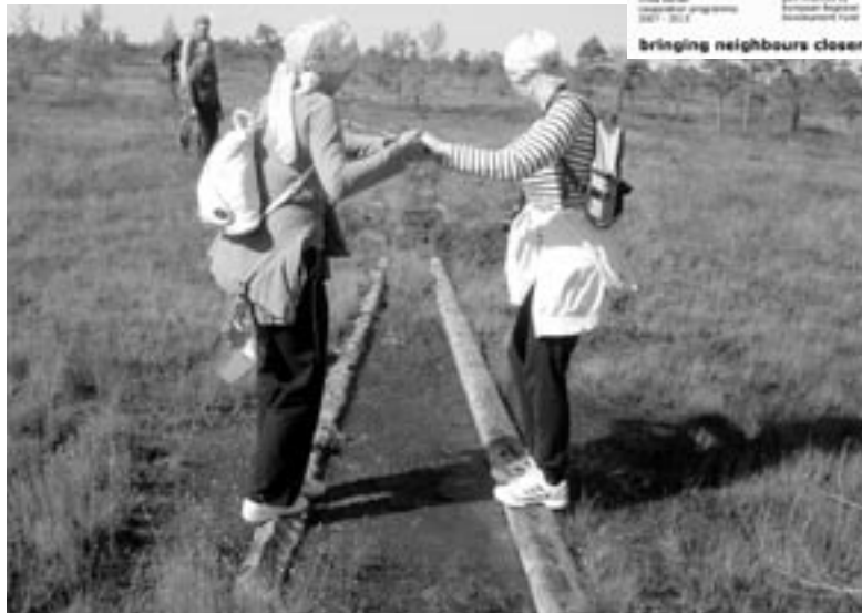
Ķemeru purvā mācījāmies uzticēties, šķērsojot draudīgu akaci.