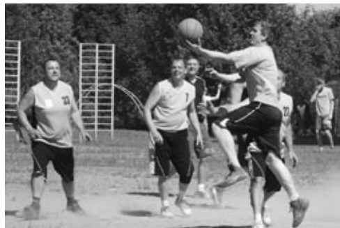
Strītbola laukums no azartiskās spēles tīts putekļu mākonī.