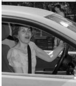
Autoveiklības sacensībās piedalījās septiņas daiļā dzimuma pārstāves.