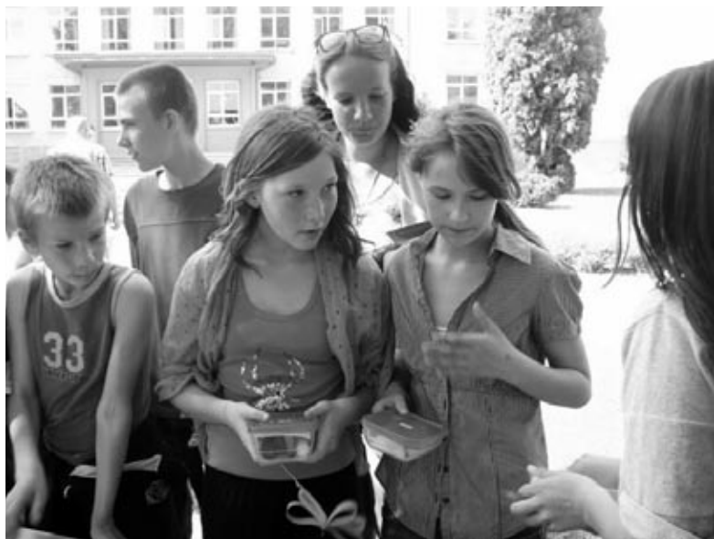
5.-8. klašu komandu pārstāvji gatavojas slēpņošanas spēles startam.