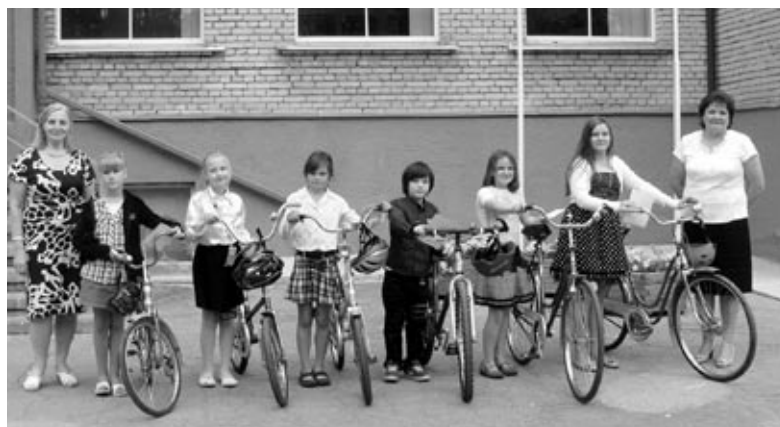
Skolēni, kuru mācību sasniegumu vidējais vērtējums gadā ir 7,5 un vairāk, savā īpašumā atkal ieguva divriteņus.

Atkal kāds mācību aplis ir noslēdzies, pa spirāli vedot mūs arvien augstāk un augstāk. [Z]