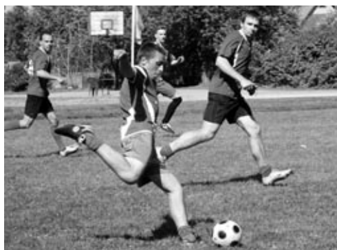
Vairāk fotogrāfiju www.iecava.lv

Svētku organizētāji saka lielu paldies visiem iecavniekiem un viesiem par aktīvo līdzdalību sporta svētkos, kā arī atbalstītājiem: policijai, Sabiedriskās kārtības dienestam, internātpamatskolai, Sporta laboratorijai, SIA «DzKS», Ceļu pārvaldei, tiesnešiem un Iecavas novada domei.