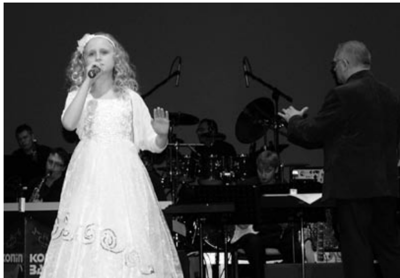
Uzstāšanās kopā ar orķestri - tā ir ne tikai vērtīga pieredze, bet arī liels izaicinājums jaunažiem māksliniekiem.