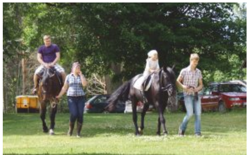
Gaidot, kamēr izcepsies pīrādziņi, viesi laiku velti netērēja, bet labprāt pavadīja laiku, sēžot «Drostalu» zirga mugurā.