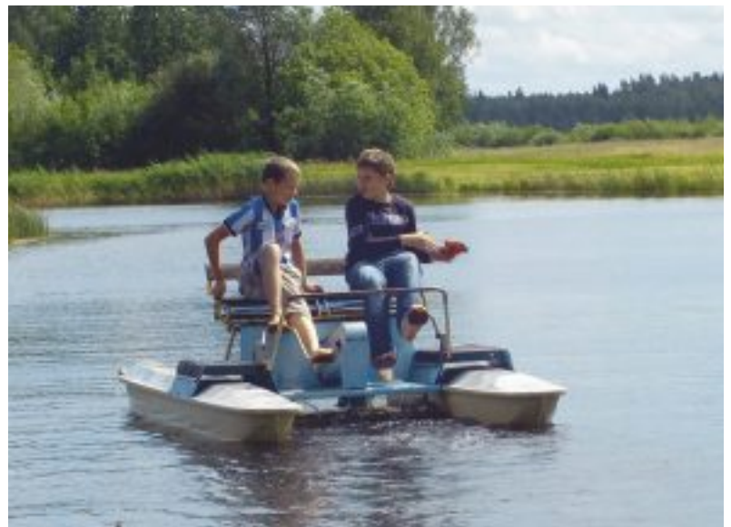
Visa pasākuma laikā, interesanti varēja doties braucienā ar katamarānu pa piemājas dīķi.