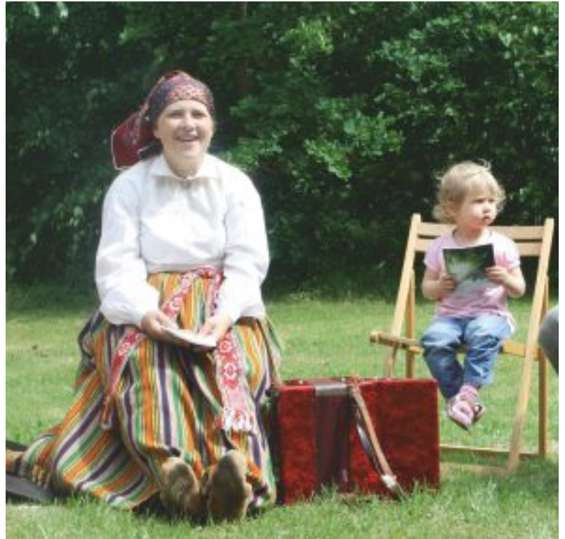
Īpaši interesanti ielīgot bija pasākuma mazākajiem apmeklētājiem, jo viņiem mūsu tradicionālās dziesmas un tērpi šķita kaut kas jauns un aizraujošs.

Klājot svētku galdu, nedrīkst aizmirst par tradicionālajiem Jāņu ēdieniem - ķimeņu sieru, raušiem un Jāņu alu. Interesanti, ka apaļā ķimeņu siera gabaliņu vajadzētu nobaudīt ikvienam, jo tas simbolizē sauli, veselību un veiksmi, taču Jāņu alus pirmajam jānobauda mājas saimniekam, lai pasargātu māju un ģimeni no nelaimēm.