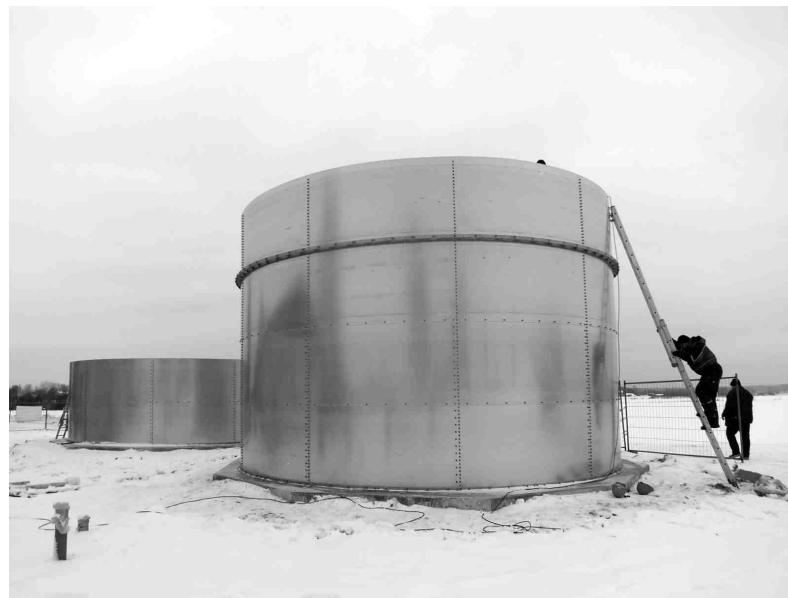
Strādnieki montē divus 260 kubikmetru lielus ūdens rezervuārus, kur uzglabāsies ūdens pirms attīrīšanas.

dernākas un ne tik jaudīgas, diennaktī spējot attīrīt 1120 kubikmetrus notekūdeņu. Novocojušās iekārtas ir jaudīgākas (1800 m 3 /dnn), bet Iecavā nav tik daudz notekūdeņu; tās ir arī uzturēšanā dārgākas, tādēļ tiks demontētas.