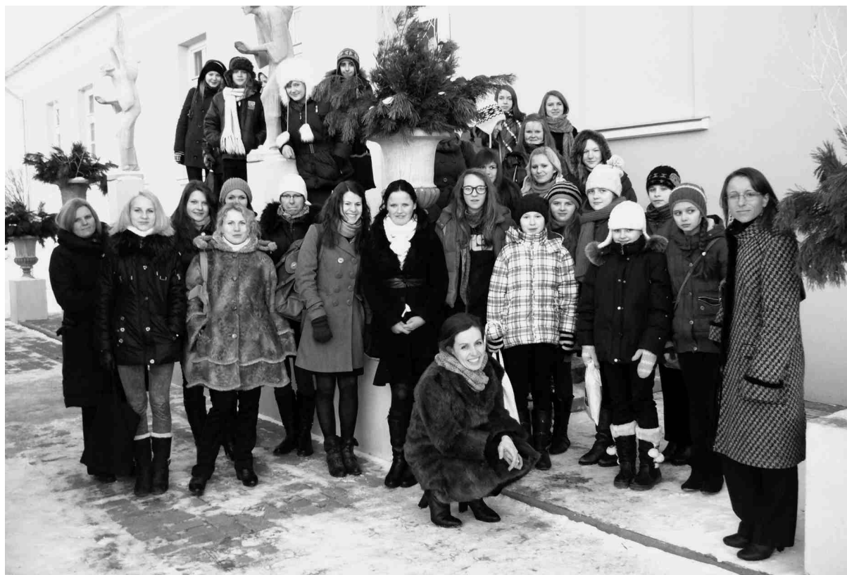
Līdz ar Ziemassvētku svinēšanas laika noslēgumu un lielā aukstuma iestāšanos noslēdzās arī mūsu koncertturneja pa Latvijas baznīcām. Par pēdējo un skanīgāko vietu 31. janvārī kļuva Bruknas muiža.

Paralēli rakstu darbiem sākam iestudēt «Ziemassvētku oratorijas» pirmās daļas. Atzīstos, gāja grūtāk, kā vēl nekad, dažbrīd pārņēma bezcerības sajūta, jo šis nebija tas mūzikas stils, kādā koklētājas bija pieradušas spēlēt līdz šim. Bet meitenes nepadevās! Nakti pa naktij, takti pa taktij, daļu pa daļai no oratorijas mēs grauzāmies cauri nošu jūklim, līdz beidzot pienāca kopmēģinājums ar kori. Ak, šausmas! Nakts negulēta, uztraukums briesmīgs, vaigi sarka un bālēja līdz brīdim, kad kora diriģente